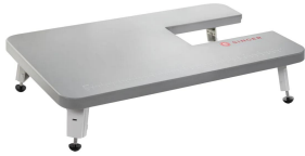
Mesa de extensión HD Mecánica