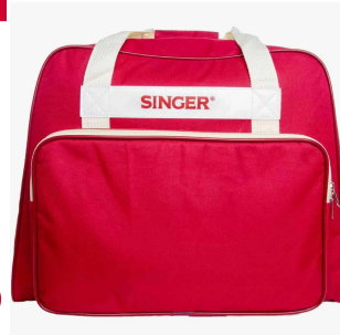
Bolso Singer Color Ladrillo