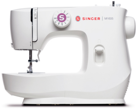
Máquina de Coser Singer M1605