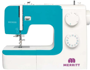
Maquina de Coser Merritt ME9500