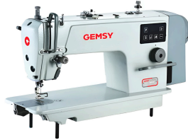
Set Máquina Industrial Recta GemSY S2 Motor Servo Directo